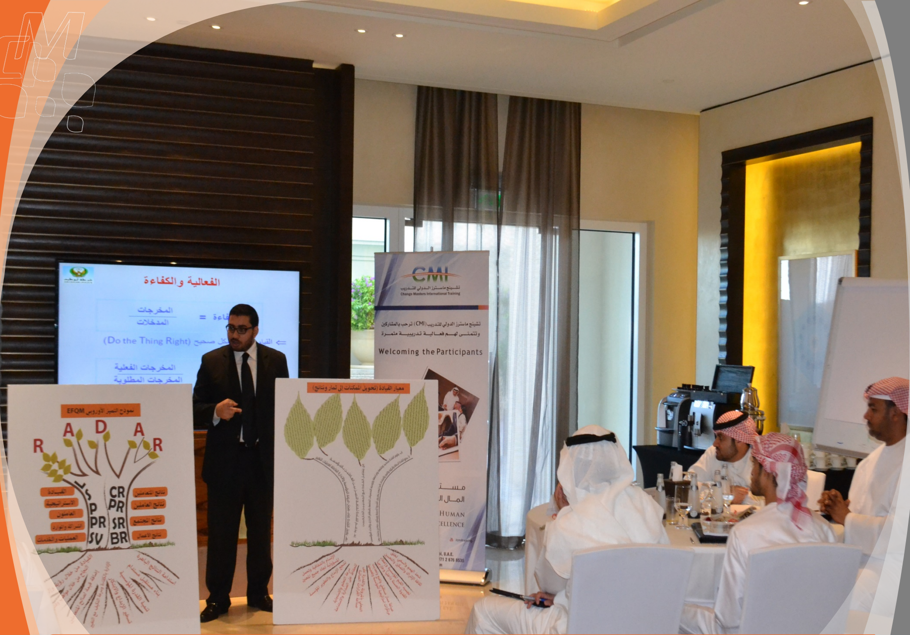
EFQM Awareness Workshop – November 2013