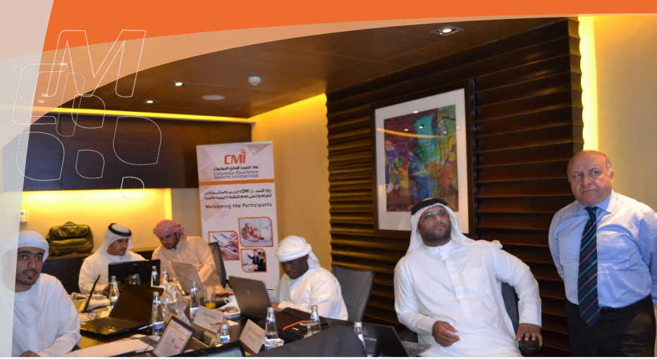
دورة مقيم معتمد – فبراير 2013