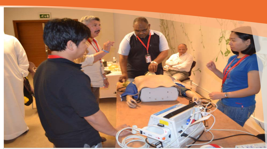
الدورات الطبية: ACLS - ابريل 2014