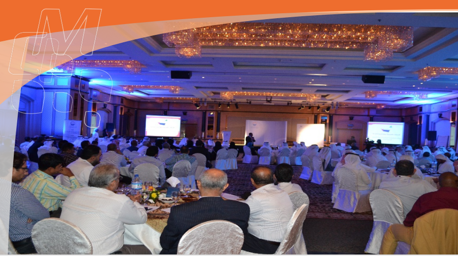
شركة العين للتوزيع - ورشة عمل نشر ثقافة التميز - يوليو 2014