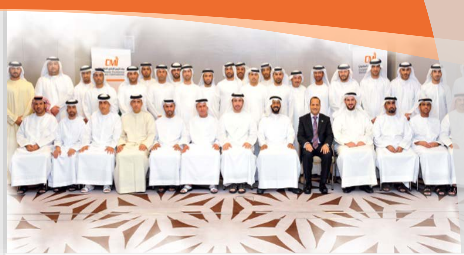
دورة "القيادة الفعالة" - 2012