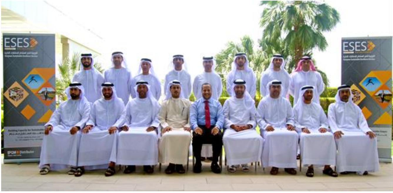
في ختام دورة في التميز المؤسسي لقادة كلية الشرطة أبوظبي - 7 مايو 2015