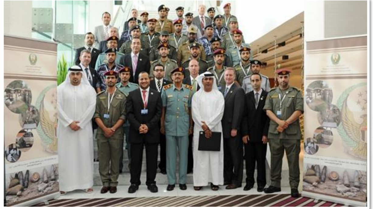
في ختام ملتقى الشركاء الأول (شركاء في التميّز) مع قادة معهد تدريب الأسلحة والمتفجرات من شرطة أبو ظبي - أبو ظبي - 24 يونيو 2014