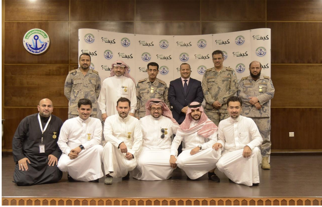
في ختام برنامج التميز القيادي لقادة العمل في ميناء جدة الإسلامي بحضور مشاركين من حرس الحدود - جدة - 23 مارس 2017