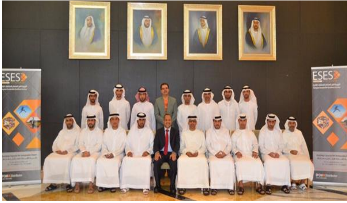
في ختام برنامج التميّز الاستباقي لمدرّاء العمليات الشرطية أبو ظبي - 18 نوفمبر 2015