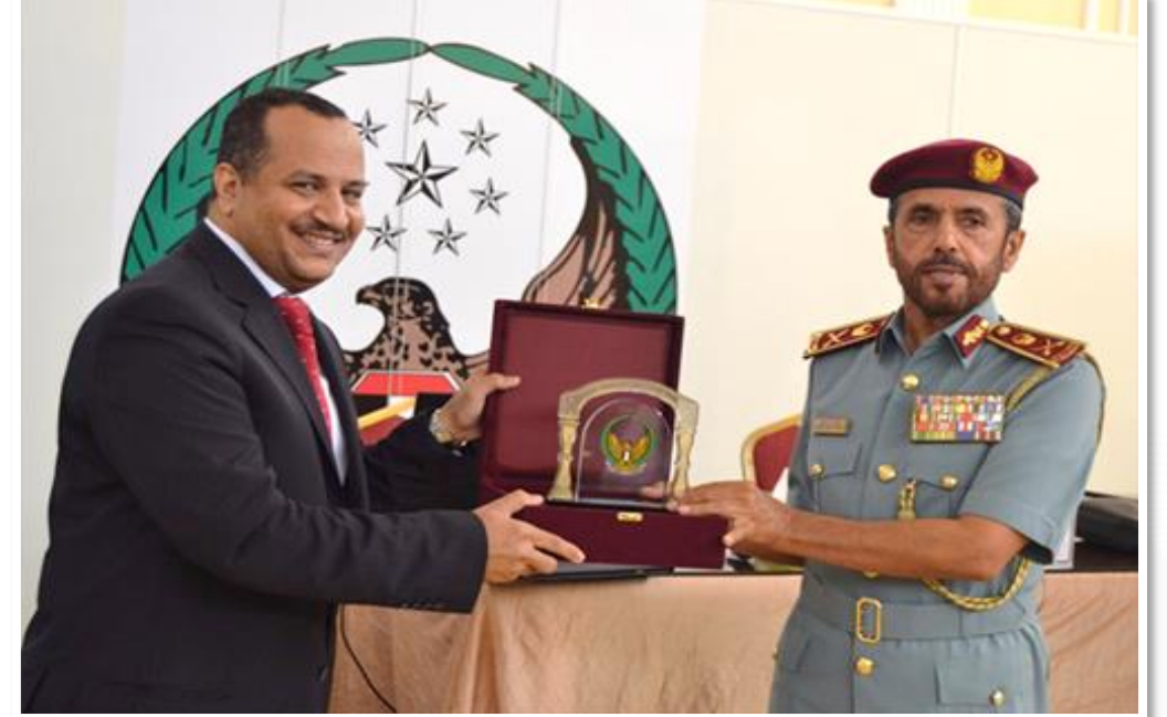
تكريم سعادة اللواء الركن خليفة حارب الخيلي - الوكيل المساعد لشؤون الجنسية والإقامة والمنافذ بوزارة الداخلية لمجموعة (CMI) الدولية في ختام ورشة (إدارة الابتكار: مفتاح الريادة المستدام) - أبوظبي - 23 نوفمبر 2015