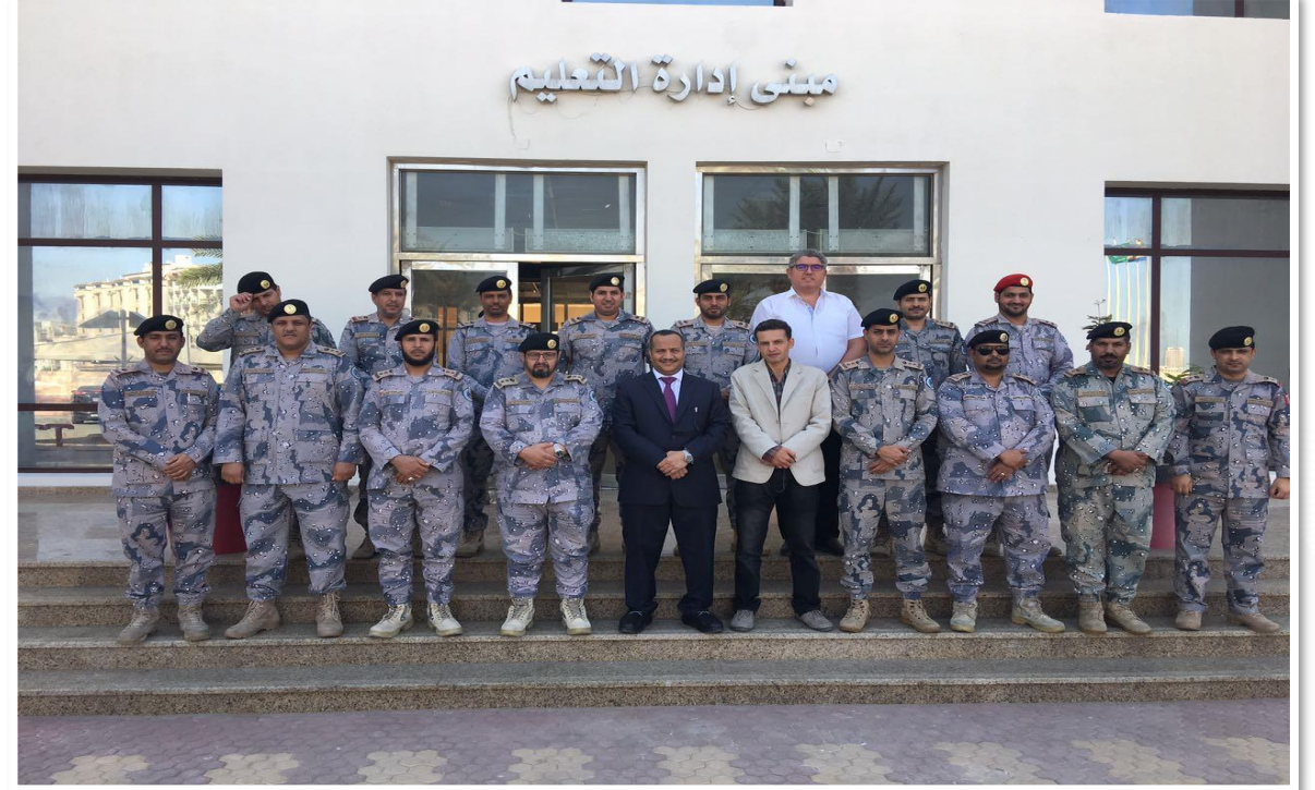
في ختام دورة في التميز القيادي الأمني لقادة أكاديمية محمد بن نايف للدراسات والعلوم الأمنية البحرية جدة - 03-01 يناير 2017